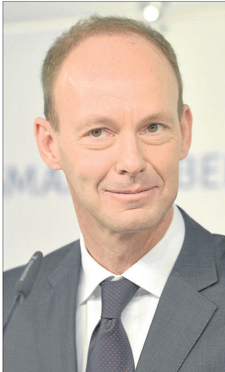
Grund zur Freude: Vorstandschef Dr. Thomas Rabe kann überzeugende Zahlen vorweisen. Die Begründung liefert er am 26. März bei der Bilanzpressekonferenz in Berlin.