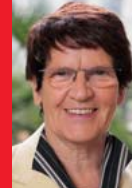
Prof. Dr. Dr. h. c. mult. Rita Süßmuth Bundestagspräsidentin a. D.