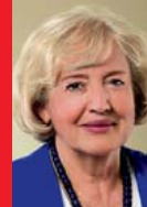
Renate Schmidt Bundesministerin a. D., Mitglied des Deutschen Bundestages