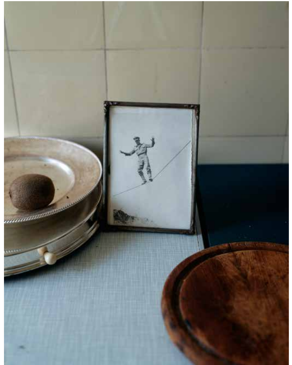
«L'équilibriste», Berlin 1994