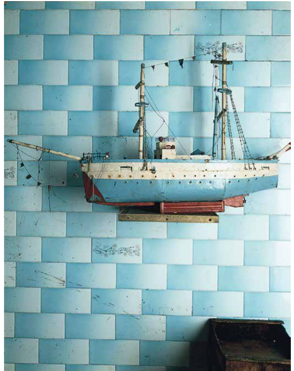
«Le bateau sur la mer», Naples 1988