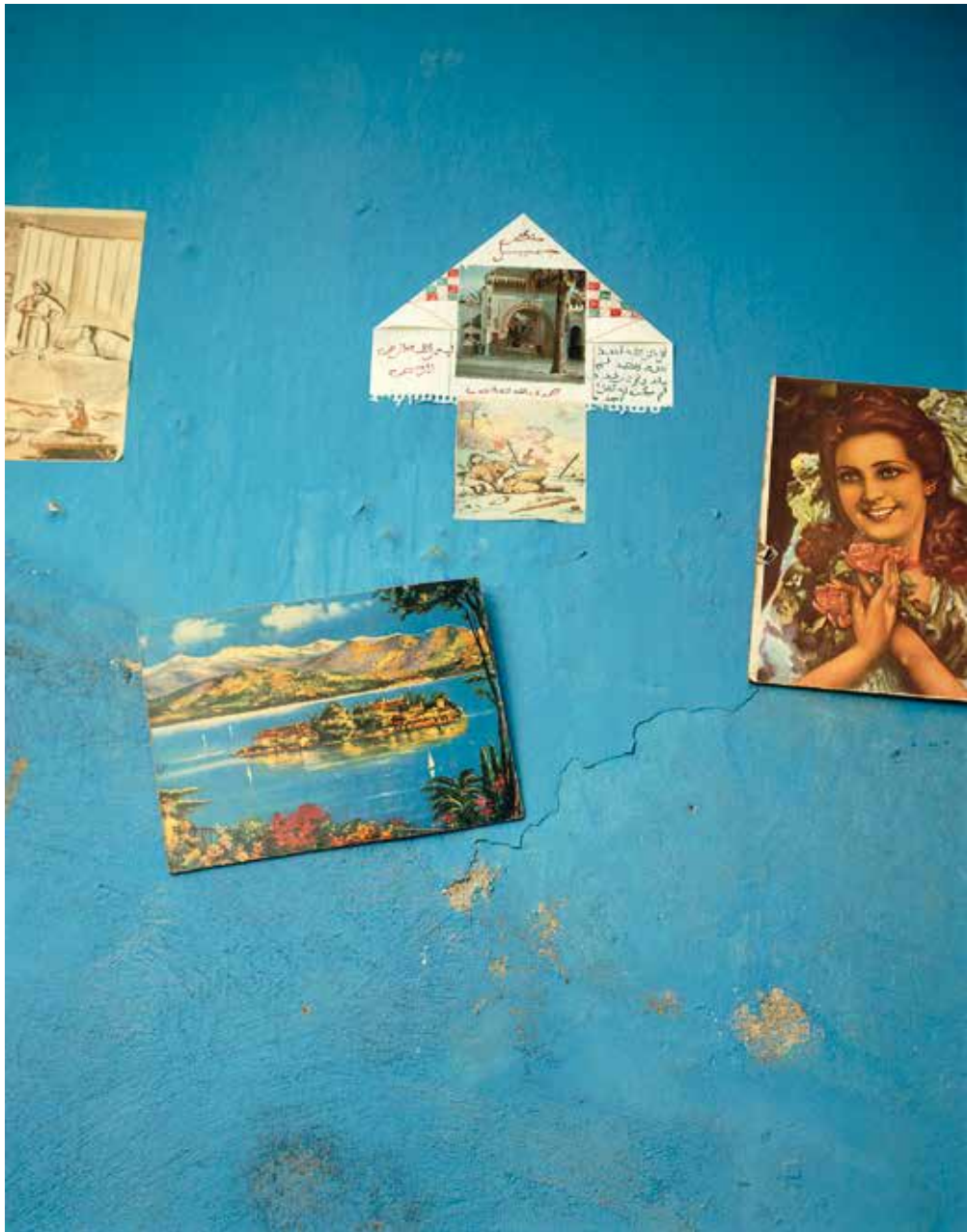
«La Dame de Monte Cassino», Marrakech 1985