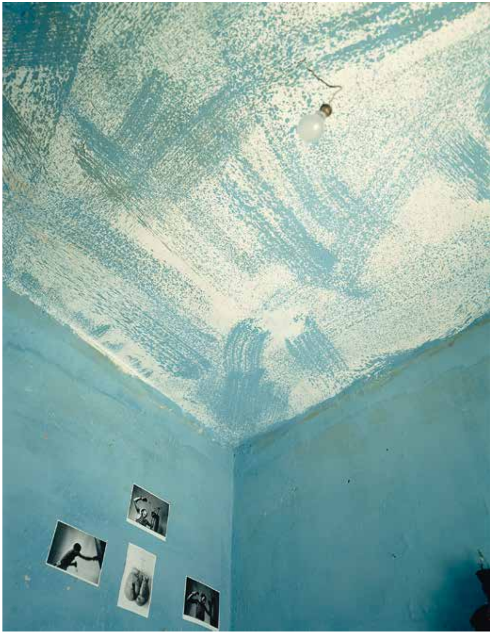
«La chambre du boxeur», Marrakech 1985