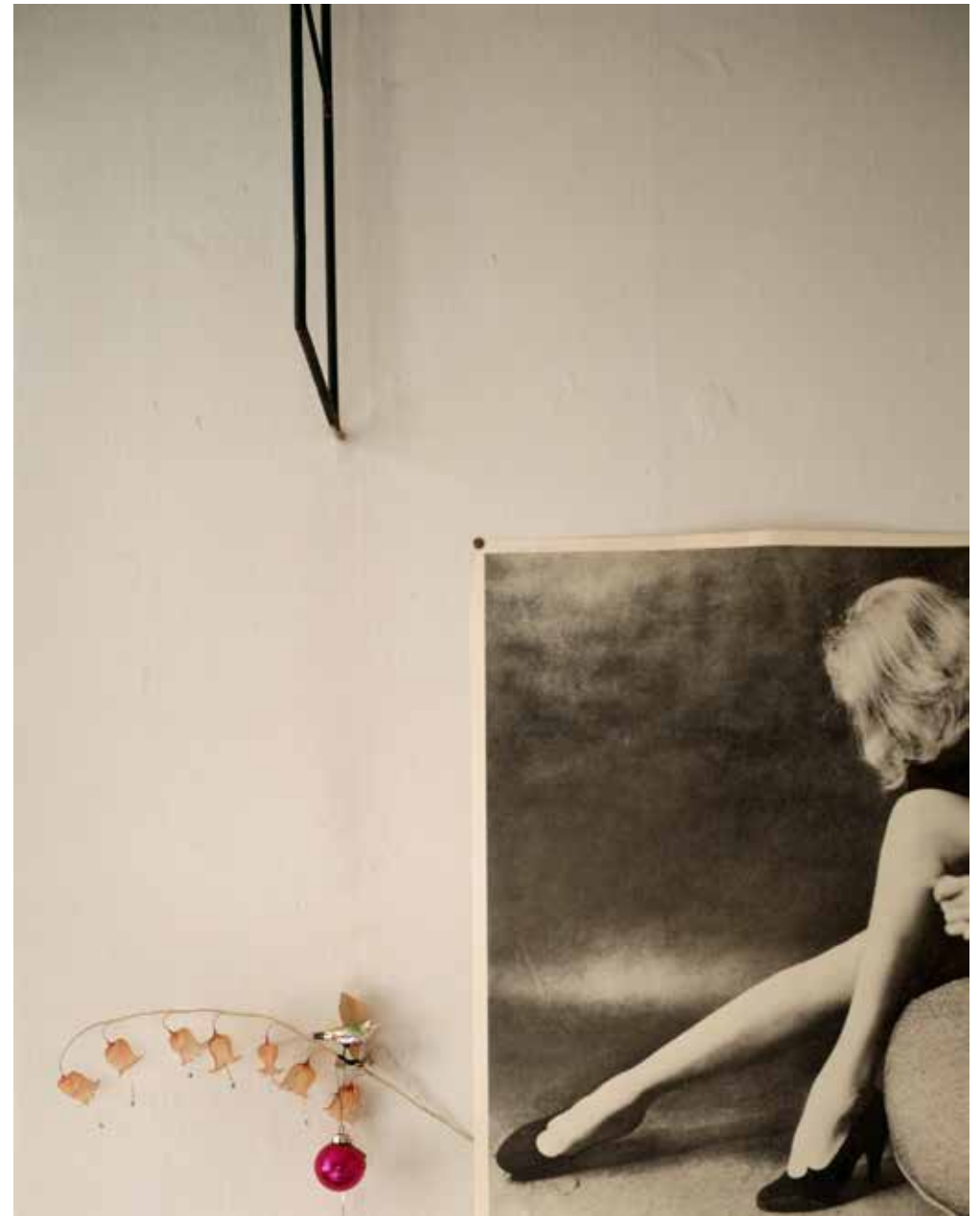
«Lily», Berlin 1994