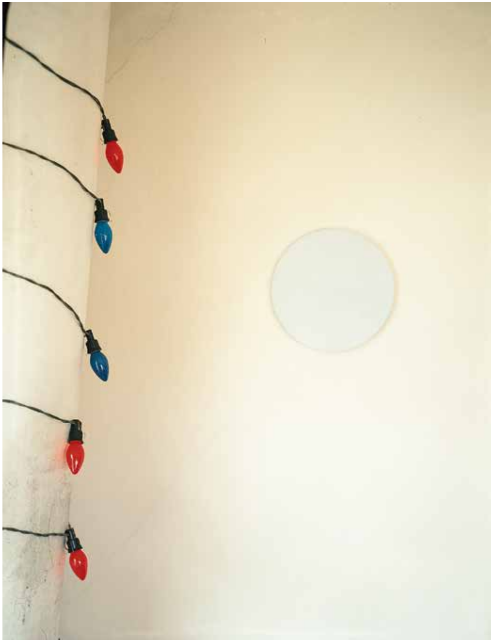
«Bannière et disque bleu», Portland USA 1989