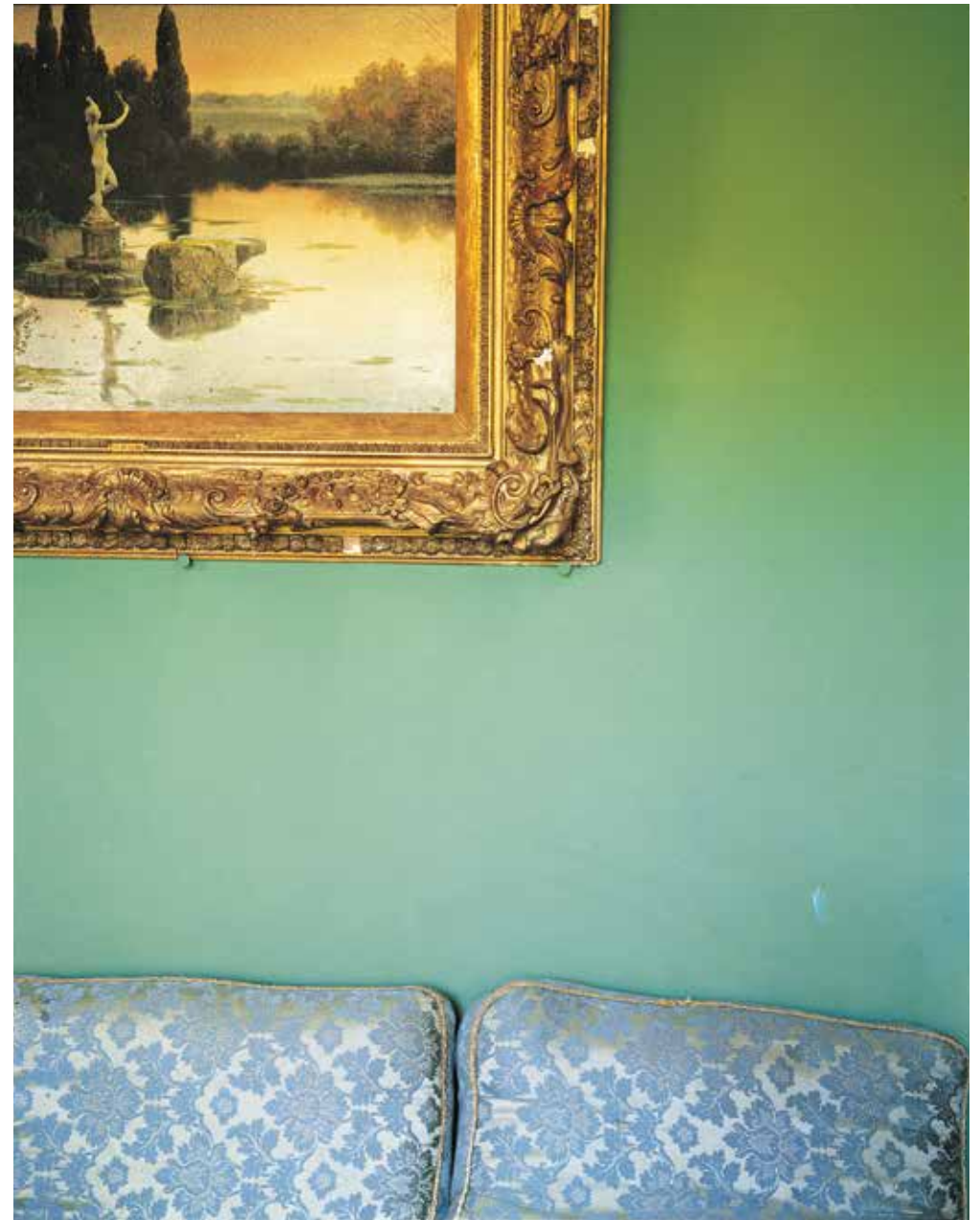
«Psyché», Villarica, Paraguay 2009