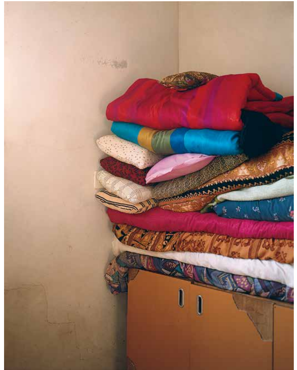
«Chambre commune», Gaza 1994